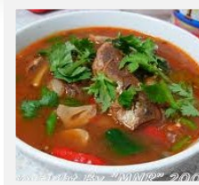
ต้มยำ..ปลากระป๋อง