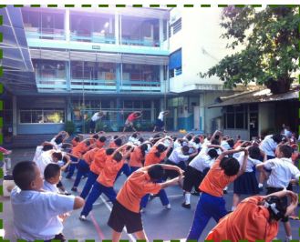
กิจกรรมหน้าเสาธงของนักเรียน โรงเรียนวัดจักรวรรดิ

หลังจากปิดภาคเรียนที่ 1 ประจำปี 2554 ตั้งแต่วันที่ 10 ตุลาคม 2554 ถึงบัดนี้ซึ่งต้องปิดต่อเนื่อง เนื่องจากกรุงเทพฯประสบกับ อุทกภัยหลายเขตทำให้ประชาชน ไม่สามารถใช้ชีวิตได้ตามปกติจึงต้อง สั่งปิดภาคเรียนต่อ... และโรงเรียนวัดจักรวรรดิ ยินดีต้อนรับสู่..ภาคเรียนที่ 2 ประจำปี 2554 นี้