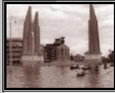
น้ำท่วมที่ถนนราชดำเนินในอดีต

ด้วยเหตุนี้กรุงเทพฯ ในอดีตจึงมากไปด้วยคลอง จนได้รับการเรียกขานกันว่า “เวนิสตะวันออก” เหตุการณ์น้ำท่วมครั้งสำคัญในกรุงเทพฯ ตั้งแต่อดีต ตั้งแต่กรุงรัตนโกสินทร์ จนถึงปัจจุบันเกิดขึ้นหลายครั้ง