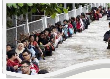
อพยพประชาชนช่วงน้ำท่วม